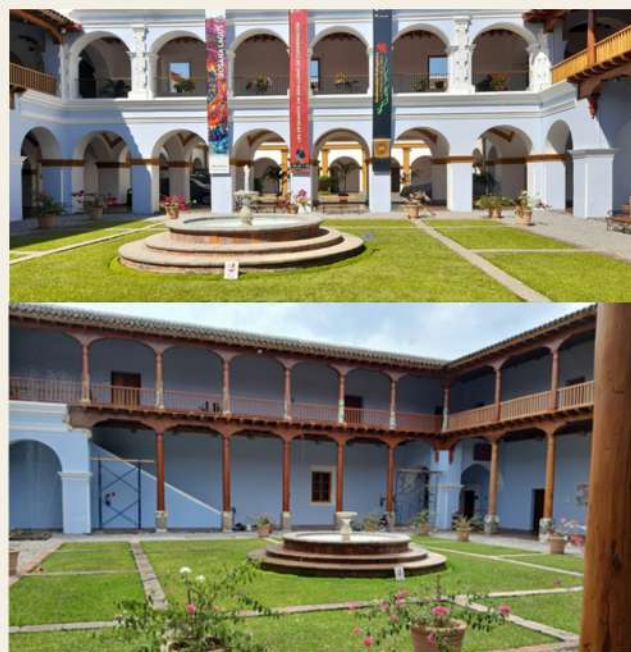
Figura 1. Vistas del patio central del Centro de Formación de Cooperación Española - CFCE.

Además, es una ciudad colonial que cuenta con servicios médicos básicos, farmacias y supermercados.