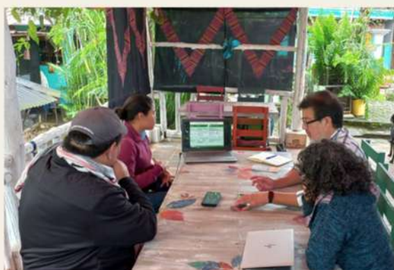
Figura 10. Miembros de la Comunidad Etnobiológica Guatemalteca reunidos con la Cooperativa "Senderos del Alto" en San Cristóbal el Alto. 03/10/2024