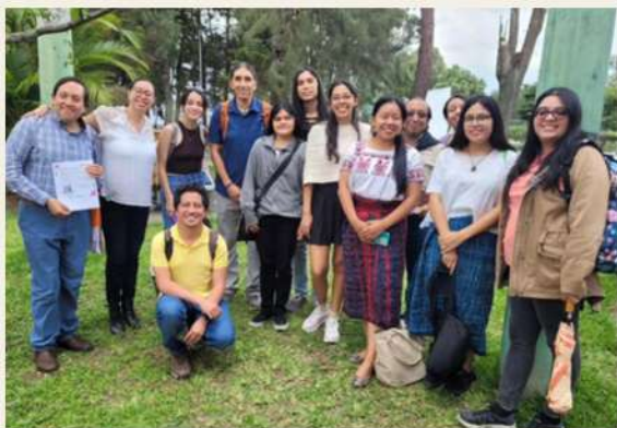
Figura 7. Participantes del Módulo V, impartido por Dr. Armado Medinaceli.

Este acuerdo de colaboración busca la organización conjunta de actividades para el congreso y el simposio, además de fomentar la participación de comunidades locales en el evento (Figura 10).