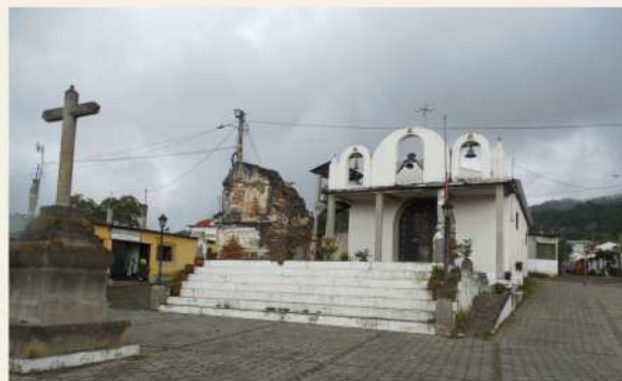
Figura 9. Plaza central de San Cristóbal el Alto, Antigua Guatemala. 03/10/2024.