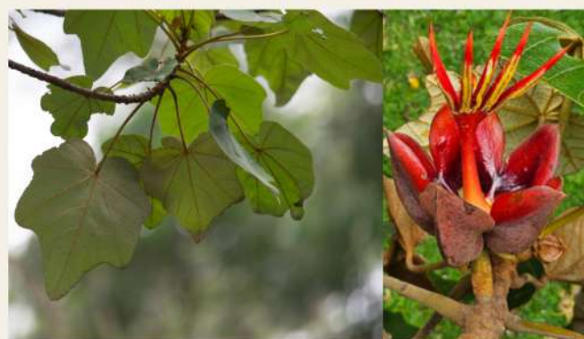
Figura 11. Hojas y flor del árbol Chirantodendron pentadactylon .

Pronto estaremos compartiendo más información sobre este simposio, el último evento académico del año, en preparación para el VIII Congreso y III Simposio en 2025. Esperamos que puedan acompañarnos.